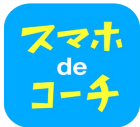
「スマホdeコーチ」アイコン