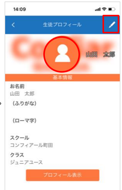
受講者プロフィール編集画面

受講者画像編集画面の「ファイルを選択」を押下し、画像を選択後、中心位置を設定し「アップロード」ボタンを押下します。